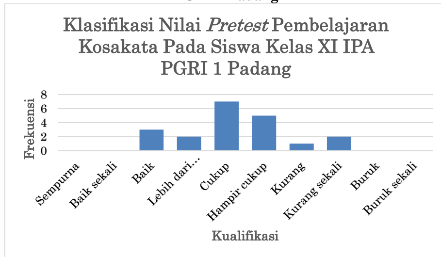
Gambar. 1 Diagram Pretest Pembelajaran Kosakata Siswa Kelas XI IPA 1 PGRI 1 Padang

Kedua , pembelajaran kosakata kelas XI IPA 1 PGRI 1 Padang setelah menggunakan media bingo berada masuk dalam kualifikasi baik sekali pada mean 86. Secara keseluruhan simpangan baku yang didapat dari pembelajaran kosakata siswa kelas XI IPA 1 PGRI 1 Padang setelah menggunakan media bingo adalah 7,58.