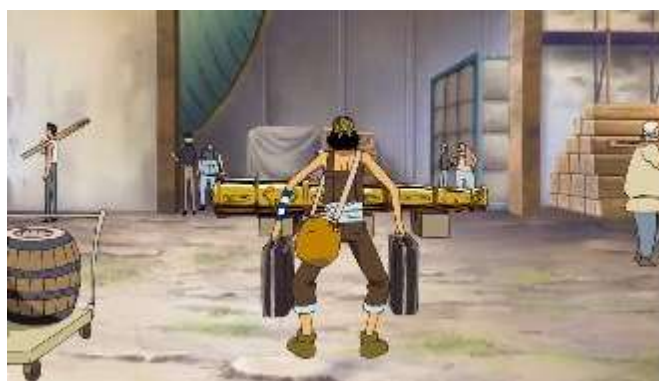
Gambar 2. Tempat pengalangan kapal

Pada kata kaeru (買える) ini, peneliti menemukan sebanyak 3 buah data yang digunakan saat seseorang mampu secara finansial membeli sesuatu, atau dalam situasi diskusi tentang kemampuan membeli, dengan kode o/K4/1, o/K4/2 dan o/K4/3. Berikut beberapa hasil interpretasi kaeru (買える) pada data o/K4/1.