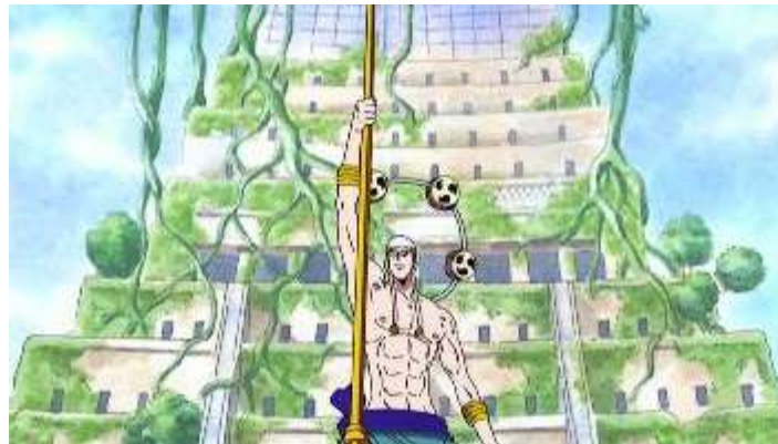
Gambar 5. Kekuasaan dewa