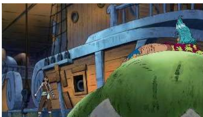
Gambar 2. Perbaikan kapal

Pada verba kaeru (帰る) ini, peneliti menemukan sebanyak 18 buah data yang digunakan saat seseorang pergi dari suatu tempat untuk kembali ke tempat yang dianggap sebuah rumah atau tempat asal seseorang, dengan kode o/K2/1, o/K2/2, o/K2/3, o/K2/4, o/K2/5, o/K2/6, o/K2/7, o/K2/8, o/K2/9, o/K2/10, o/K2/11, o/K2/12, o/K2/13, o/K2/14, o/K2/15, o/K2/16, o/K2/17 dan terakhir o/K2/18. Berikut beberapa hasil interpretasi data pada verba kaeru (帰る).