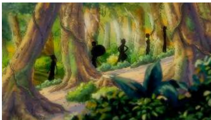
Gambar 7. Berbincang di hutan