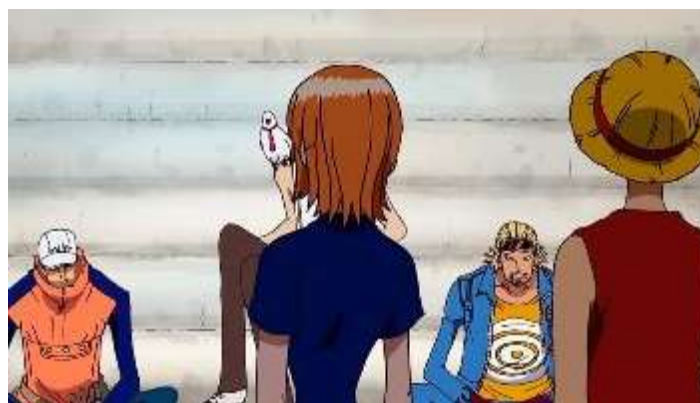
Gambar 4. Keputusan terbaik

Pada verba kaeru (換える) ini, peneliti menemukan sebanyak 5 buah data untuk menunjukkan kemampuan seseorang untuk memelihara hewan dengan kode o/K7/1, o/K7/2, o/K7/3, o/K7/4 dan o/K7/5. Berikut hasil interpretasi data pada verba kaeru (換える).