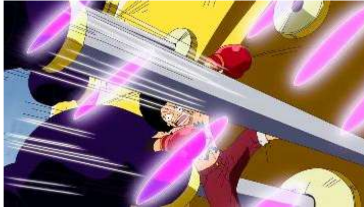
Gambar 6. Serangan berkali-kali