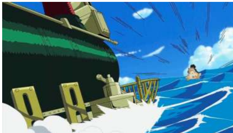
Gambar 1. Gambaran situasi

Pada nomina kaeru (蛙) ini, peneliti menemukan sebanyak 16 buah data yang digunakan sebagai nama hewan amfibi yang memiliki ciri khas dapat melompat dan hidup di dua habitat, dengan kode o/K1/1, o/K1/2, o/K1/3, o/K1/4, o/K1/5, o/K1/6, o/K1/7, o/K1/8, o/K1/9, o/K1/10, o/K1/11, o/K1/12, o/K1/13, o/K1/14, o/K1/15 dan terakhir o/K1/16. Berikut beberapa hasil interpretasi data pada nomina kaeru (蛙).