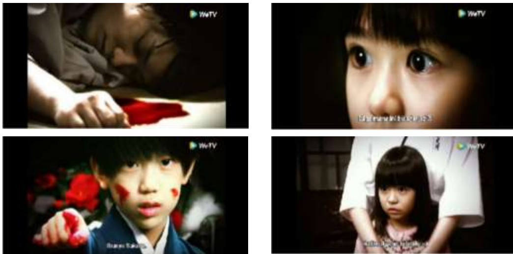
Gambar 3.1. Scene Penemuan Ayah, Ibu yang Dituduh

Kutipan dialog kunci: “Bagaimana ini bisa terjadi...?”