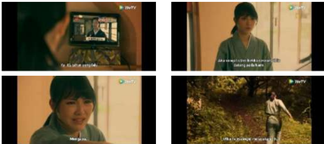
Gambar 3.4. Scene Berita Televisi

Kutipan dialog kunci: “Aku sangat stress ketika seorang iblis datang pada kami...”